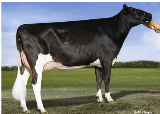
REGANCREST DGR BRYSHA